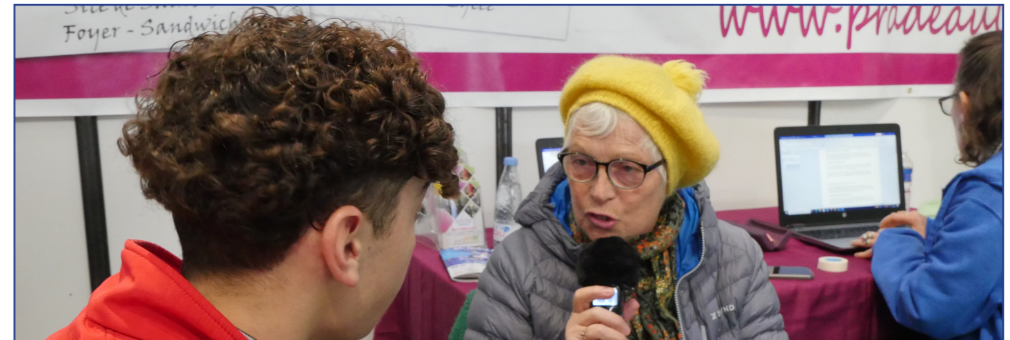
Le lycée Pradeau-La Sède mobilisé contre le cancer !

Dans le cadre de son programme Lycée Solidaire, qui encourage les élèves à s'engager auprès d'associations locales, le lycée Pradeau-la-Sède mène plusieurs actions, dont une en faveur de l'association locale de la Ligue contre le cancer 65.